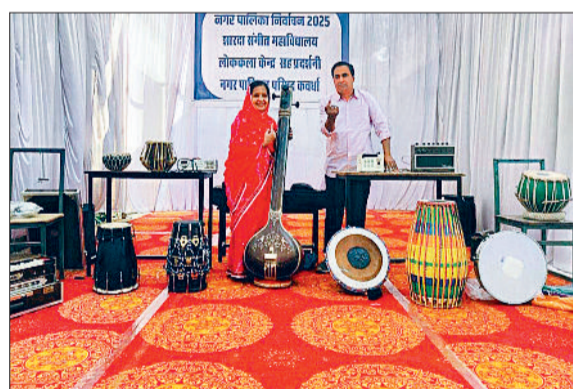
संगीत महाविद्यालय में लगाई गई वाद्य यंत्रों की प्रदर्शन, बनाया गया सेल्फी जॉन