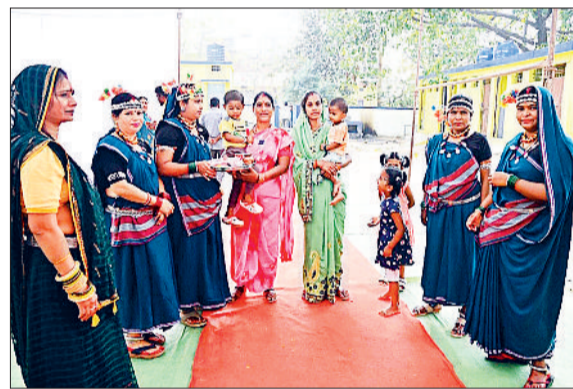
मतदान करने केन्द्रों में पहुंचे मतदाता का किया गया स्वागत