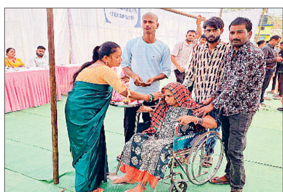
मतदाताओं को मतदान केन्द्रों तक आने से नहीं रोक पाई उनकी समस्या