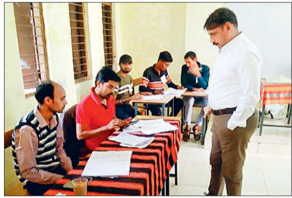
कलेक्टर करते रहे मतदान केन्द्रों में मतदान प्रक्रिया का निरीक्षण