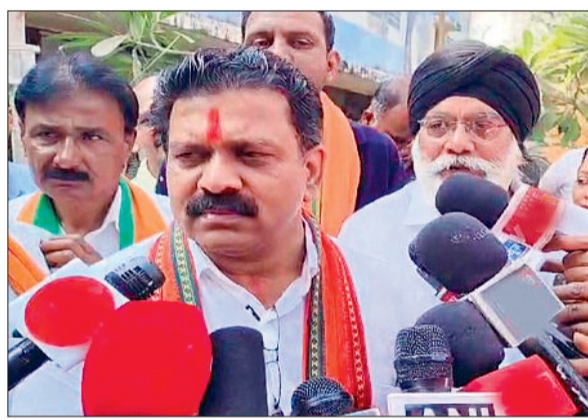
मतदाता केन्द्र व राज्य सरकार के अनुकूल चाहते हैं निकायों सरकार